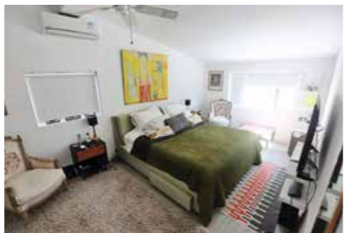
▲主人房佈置溫暖和諧，牀上的畫及靠窗的小畫也是波蘭藝術家的作品。