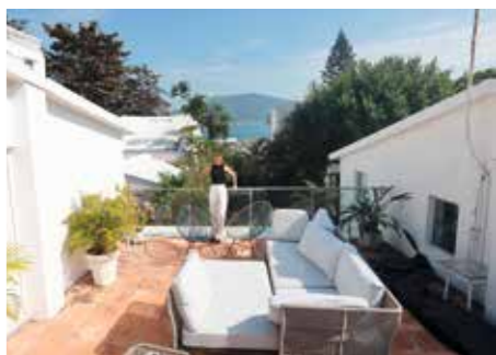
▲連接一樓的小通道變成 roof top 花園，從這裏可遠眺海景，心曠神怡。