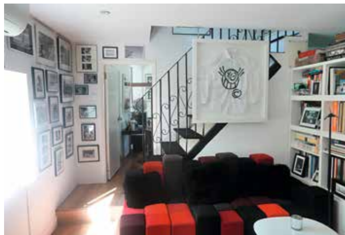
▲ Frederic的母親是攝影師，她替Krystyna一家拍攝的溫馨生活照，拼湊成這個family wall。而鑲起了的恤衫，是Frederic某次在派對上遇上Andre Saraiva，他直接在Frederic的恤衫上畫畫，成為一件獨一無二又無價的藝術品。

來自法國的 Krystyna Winckler，三年多前隨丈夫 Frederic 由巴黎來港，她亦藉此機會發展她藝術平台的事業。Krystyna 與丈夫皆是在藝術家庭內成長，自幼與畫和相片為伍，今次帶着一部分喜愛的收藏品來港，把位於赤柱的獨立屋粉飾得如藝廊一樣，Krystyna 表示每一件收藏品皆有故事，而且只會收藏非常限量的舊時代黑白相片，突顯家居的收藏品更加珍貴。