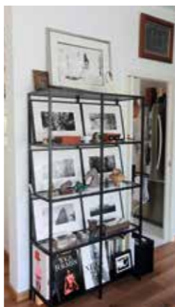
▲ 位於飯廳的牆，以有歷史價值的黑白相片，拼湊出懷舊味道。