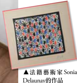
▲ 法籍藝術家Sonia Delaunay的作品